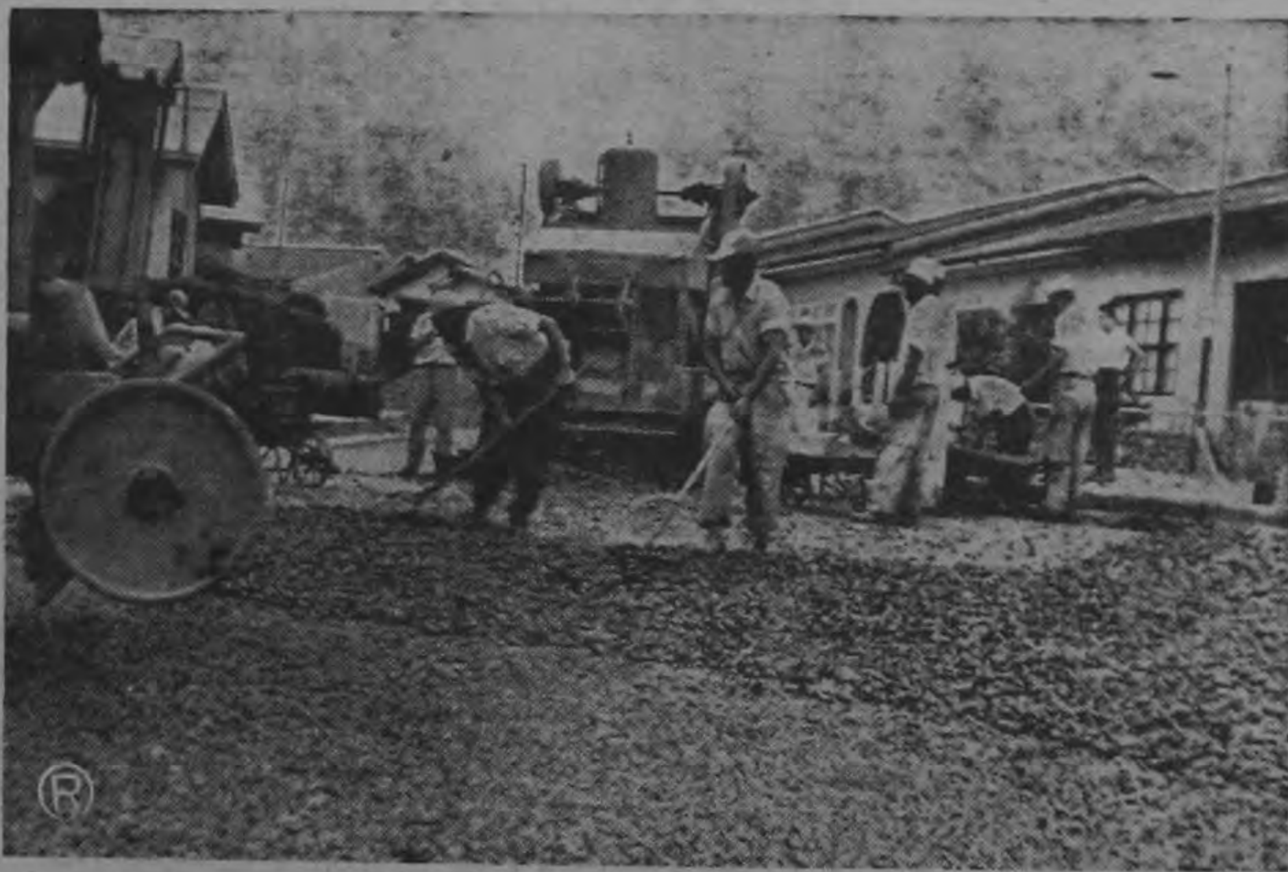
Cuadrillas y equipos municipales que en la Ciudadela Calderón Muñoz hacen el asfaltado de nuevas calles y reparan las viejas con un costo total de ₡ 100.000.00 de los cuales el INVU aporta ₡ 60.000.00