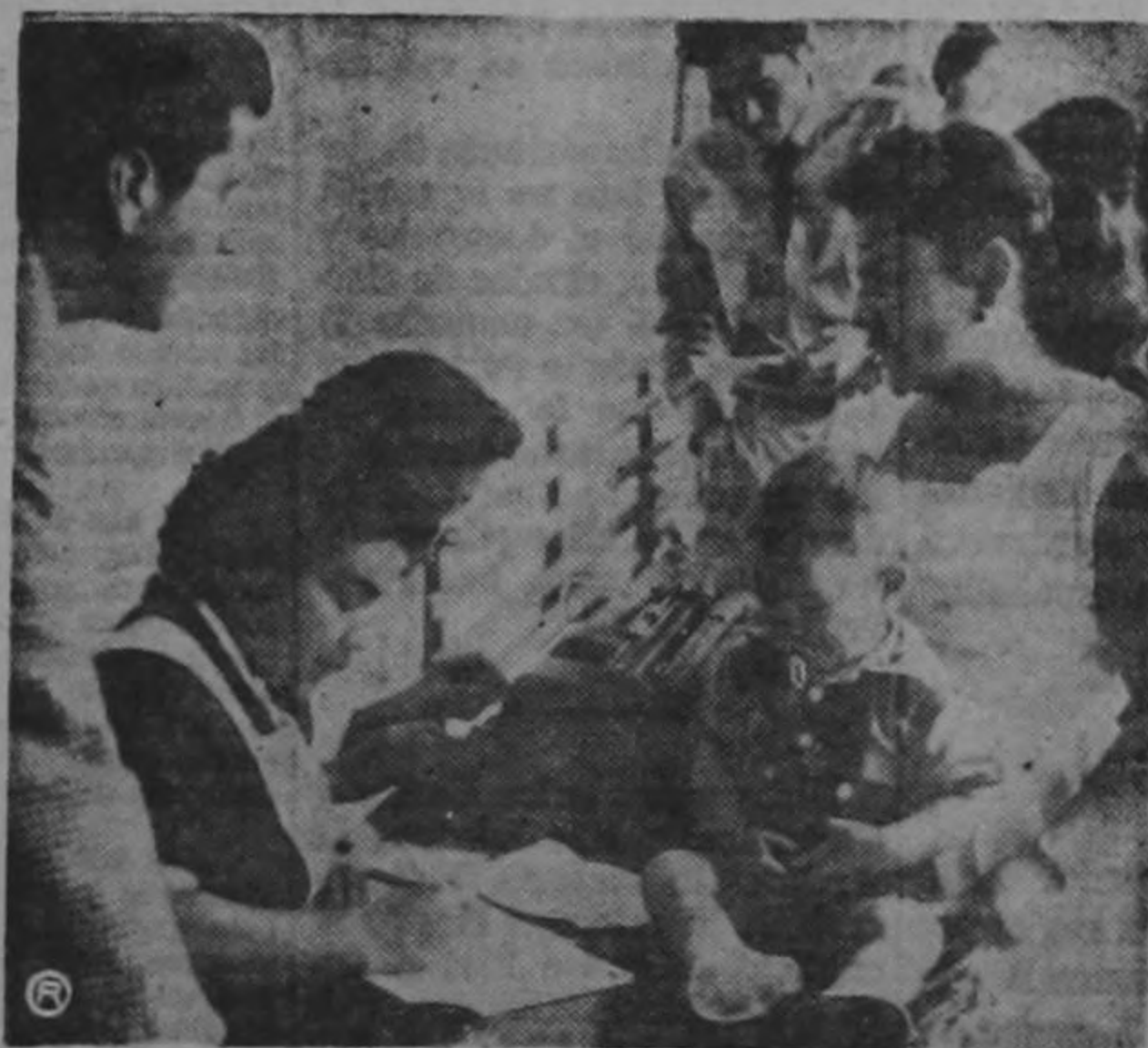
VACUNA CONTRA LA POLIOMIELITIS.