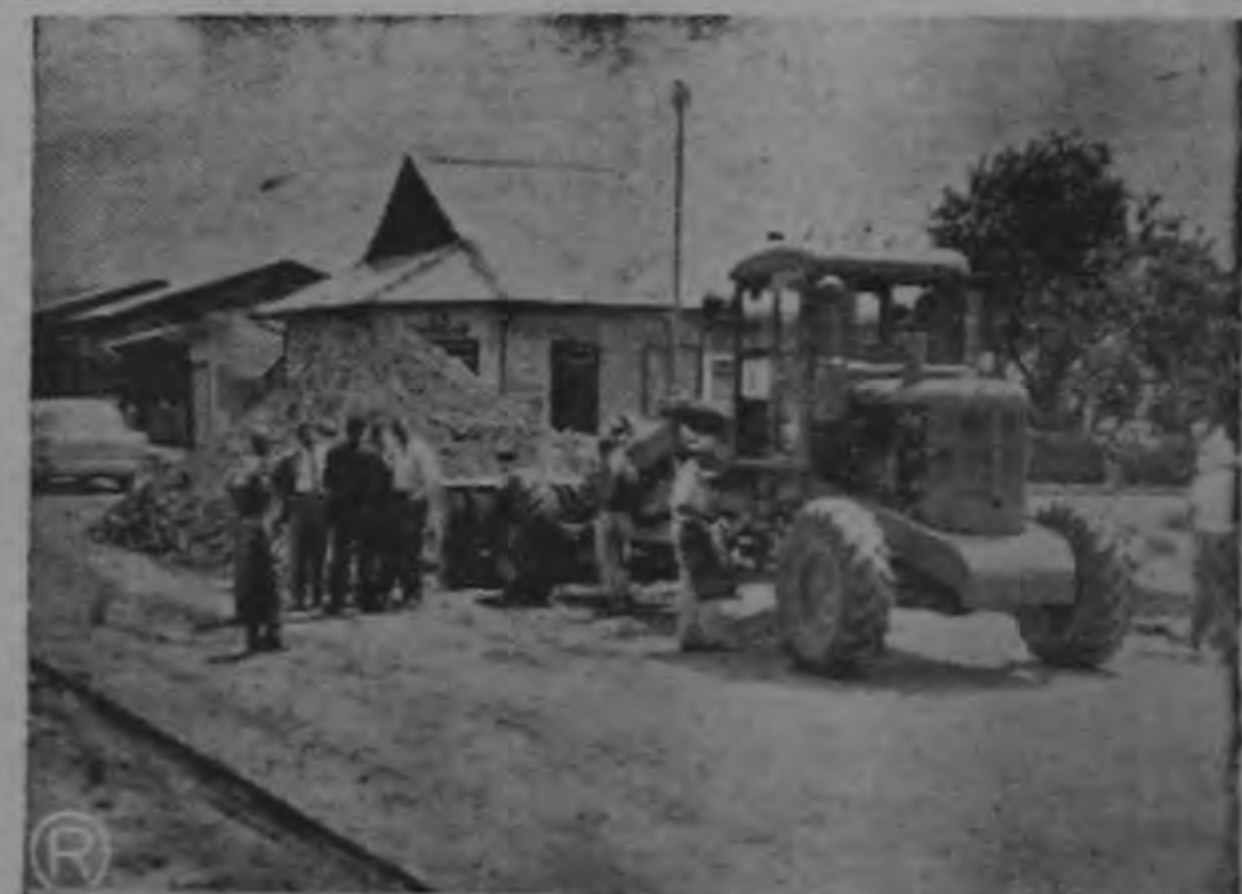
En la calle 20 Sur, entre carretera a Alajuelita y avenida 32, la motoniveladora municipal prepara la vía que va a ser asfaltada y en la cual se instaló ya nueva cañería.

pósito las agencias aduanales deben seguir un procedimiento que algunas veces tarda alrededor de 3 meses y se da el caso que confronta la firma Felipe J. Alvarado, de tener un depósito de esta clase, alrededor de ₡ 60.000.00. En cambio los agentes comerciales visitan el país y en un término de una semana hacen sus negociaciones y prosiguen en su gira.