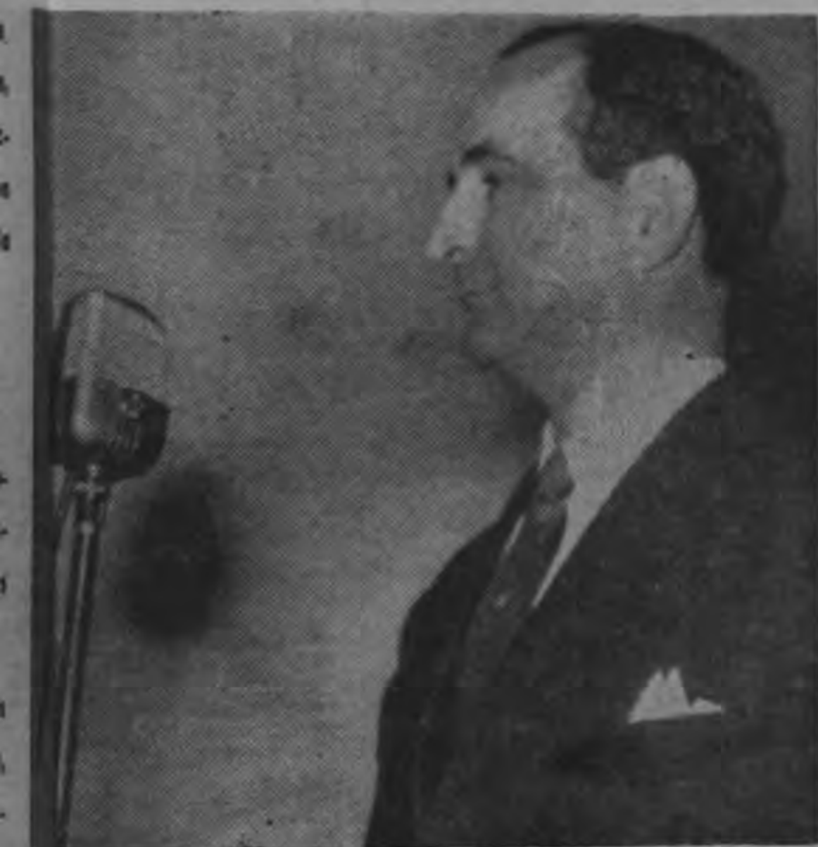
Señor Presidente de la República don José Figueres.

ALMA TICA - RADIO MONUMENTAL - SELYCTA - RADIO UNIVERSAL - RA- SIO - RADIO PARAMOUNT.