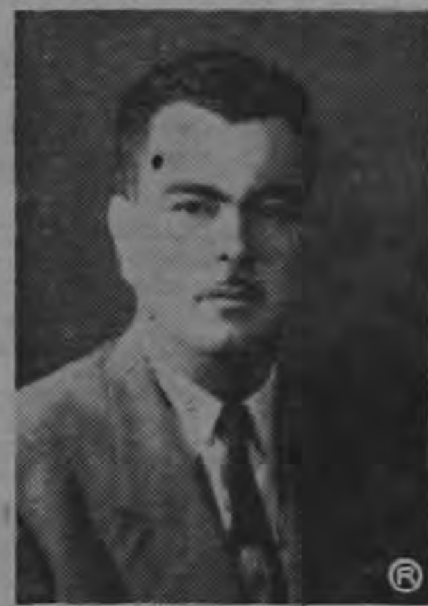
MINISTRO ESPINACH ...invitado por Naciones Unidas...