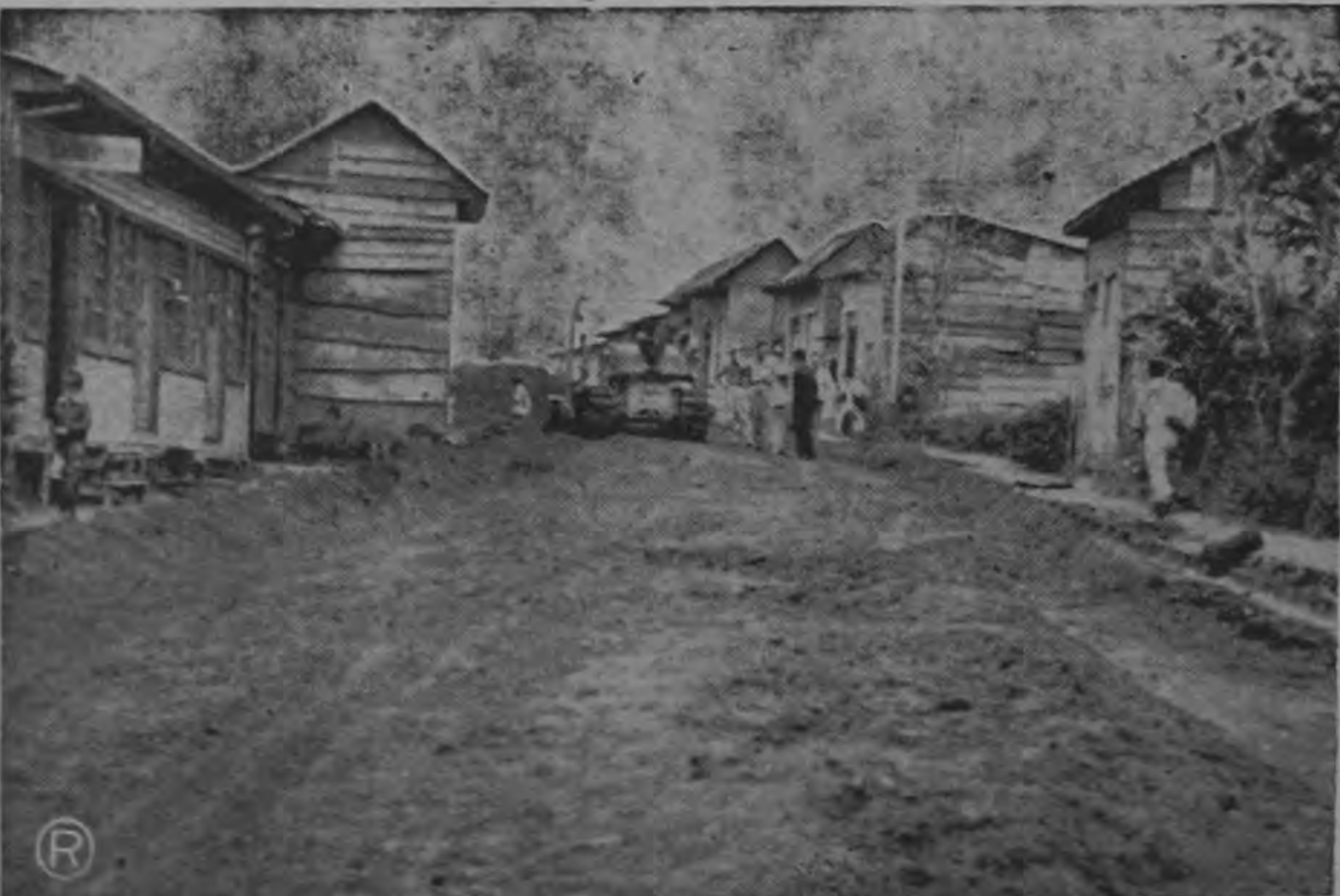
El Barrio Luna Park que antes no había sido considerado en ningún plan de los gobiernos municipales de San José tendrá cañería nueva y su calle lastrada, la cual entroncará con la carretera a San Sebastián por medio de un puente que construirá la Municipalidad.