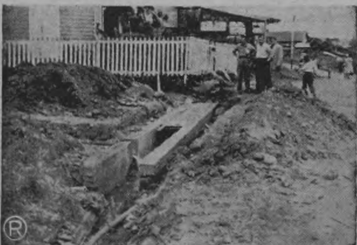
Una de las muchas acequias de aguas verdes al descubierto, que serán captadas por el sistema de alcantarillas que la Municipalidad construye en los barrios del Sur de San José.